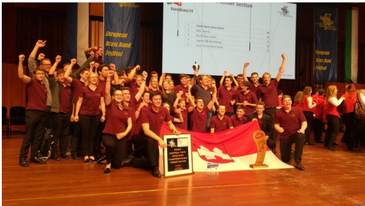
Die Europameister