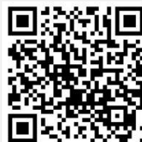
Bildergalerie der Musikschule

www.innsbruck.gv.at/musikschule https://msibkvideos.pictureproductions.eu